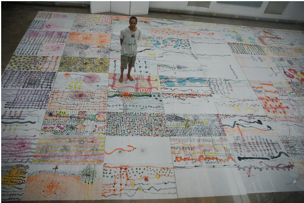
Beijing Studio View 北京工作室 2010

彼得·韦恩·刘易斯: 弯曲的时间 - 从金斯敦到北京将于 2019 年 7 月 6 日至 21 日在红门画廊展出。